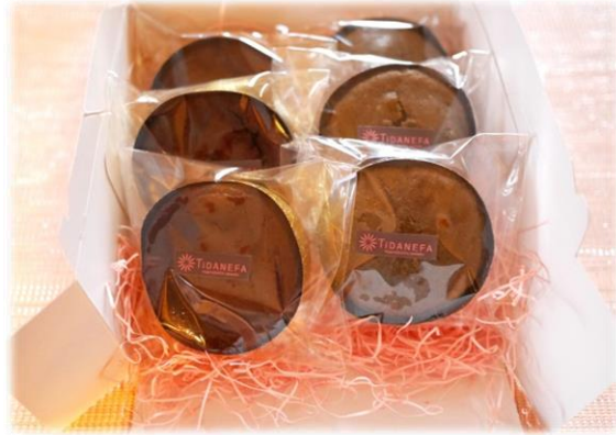
ギフトボックスのイメージ（14×14×7 cm の箱入り）

完全予約製造のため、 お届け日の4日前以降のキャンセルはお受けできません どうかご理解のほどよろしく願いいたします お代金お振込後～お届け日の5日前までのキャンセルにつきましては、返金手数料を差し引いてご返金いたします